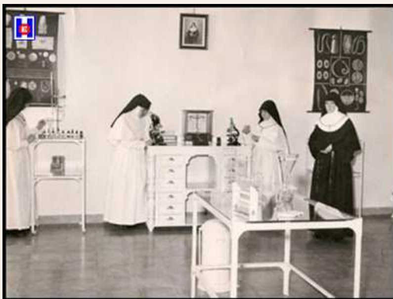
FOTO 3 Siervas de María. Escuela de Enfermería, Roma 1907

A las Siervas de María se les llama las enfermeras de cuerpo y alma por amor de Dios.