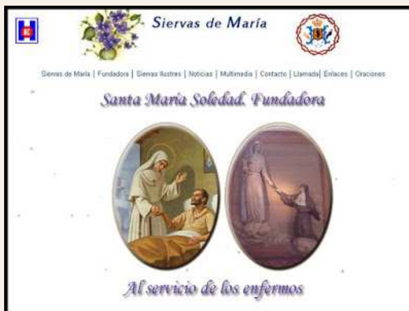
FOTO 1 Siervas de María