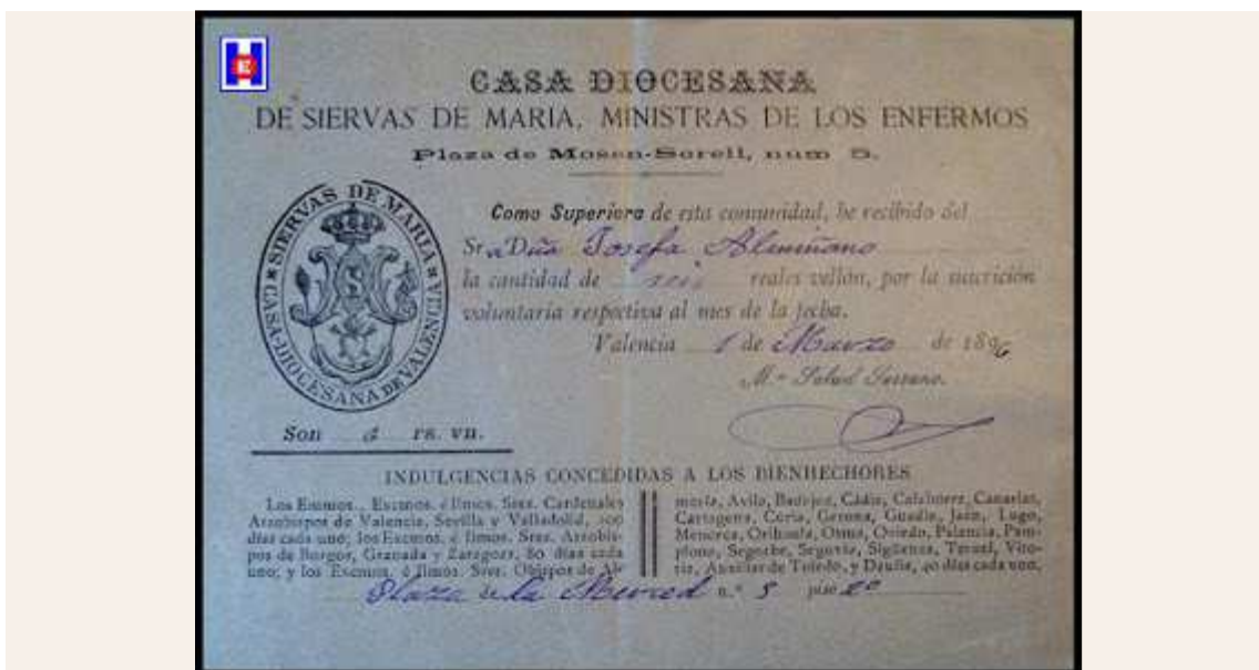
FOTO 2 Recibo de limosna de 1896 en Valencia

Lanzarote sufría la llamada crisis de la barrilla, por lo que este mecenas de la capital isleña multiplicó sus actividades para poder paliar las necesidades de los habitantes de su ciudad que comían tuneras, raíces de plantas silvestres, muriendo algunos de hambre.